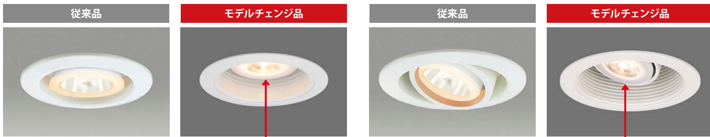
モデルチェンジ品は適合ランプが突出しなくなります。

首振り範囲は約30度、回転角は360度で、従来品以上の操作幅です。 天井裏が見えにくい構造となり、意匠性がアップしました。